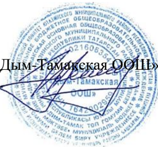
График родительских собраний МБОУ «Дым-Тамакская ООШ» на 2024-2025 учебный год